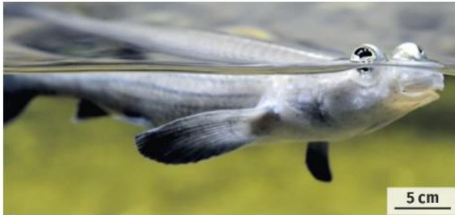
1 Un anableps à la surface de l'eau, à la recherche d'une proie. L'animal reste la plupart du temps dans cette position.

L'anableps, aussi appelé four-eyed fish (« poisson à quatre yeux »), vit dans les eaux douces dormantes d'Amérique centrale. Il cherche ses proies à la surface de l'eau, des insectes par exemple. Ses prédateurs se trouvent dans l'eau.