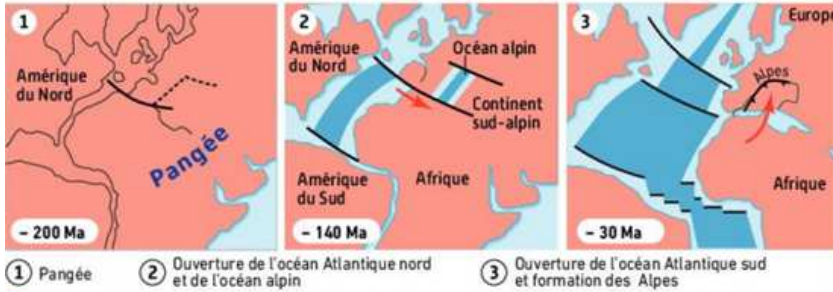
Cartes paléogéographiques de quelques étapes de l'histoire des Alpes.

Reconstituez l'histoire géologique de ces métagabbros et montrez qu'elle est en accord avec les cartes paléogéographiques de l'histoire alpine.